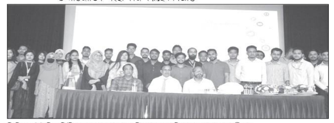
প্রিমিয়ার ইউনিভার্সিটিতে ব্যবসা-প্রশাসন বিভাগের সেমিনারে অংশগ্রহণকারীবৃন্দ