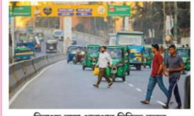
নিরাপদ রাস্তা পারাপার নিশ্চিত করুন ১১ম জুলাই থেকে মাসে মাসে ছাড়া পচাচাঁ-সেহু আছে। এতদেব মধ্যে ভিলাই কোনোভাবে ব্যবহার করা হয়।