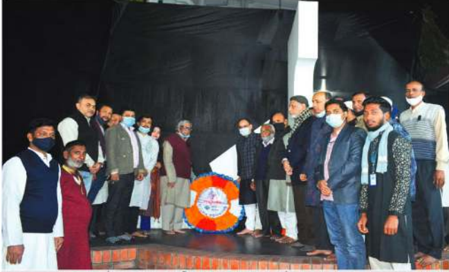
প্রিমিয়ার ইউনিভার্সিটিতে মহান শহীদ দিবস ও আন্তর্জাতিক মাতৃভাষা দিবস উদযাপন