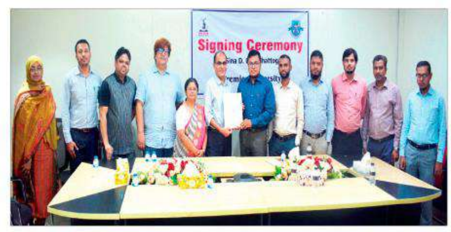
প্রিমিয়ার ইউনিভার্সিটি ও দি ইবনে সিনা ট্রাস্টের এমওইউ স্বাক্ষর