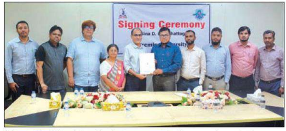
প্রিমিয়ার ইউনিভার্সিটি ও দি ইবনে সিনা ট্রাস্টের মধ্যে এমওইউ চুক্তি স্বাক্ষর অনুষ্ঠানে কর্মকর্তাবৃন্দ